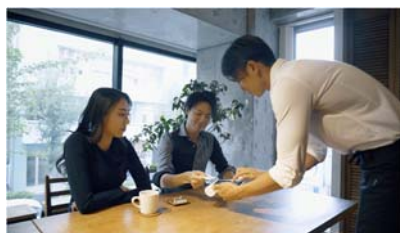
テーブル決済の様子